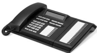
OpenStage 30 s OpenStage Key Module 15